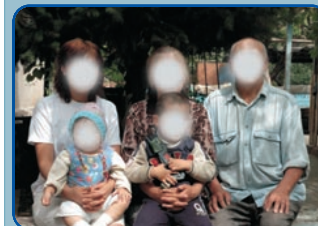
Familien som mistede deres søn under tragiske omstændigheder.