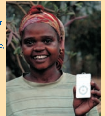
Etiopisk pige med en MegaVoice

En fistel er en smal, rørformet kanal fra et hulrum i kroppen til et andet. Skaden kan opstå i forbindelse med kompliceret fødsel, som følge af stærkt langvarigt pres mod bækkenet.