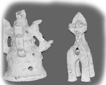
Indiske husguder

Han slutter på følgende måde: ”Vi takker Gud for jeres støtte, som gør det muligt for os at sende Bhili programmer, og vi beder om, at det må være en kilde til at mange må gå ind i Hans Rige.”